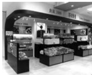
池袋ISPの芥川製菓の直販ショップ。年中無休で月～土10:00～20:30、日祝10:00～20:00の営業 ☎03-5955-7311 (店舗直通)