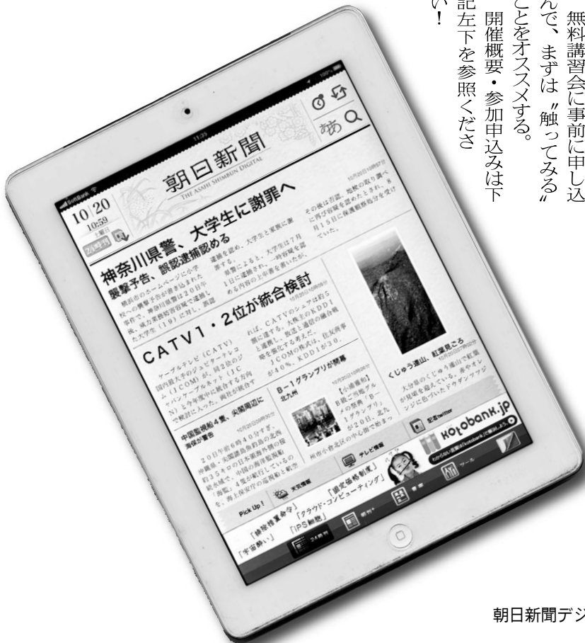
朝日新聞デジタル

新聞の電子化が唱えられて久しい。すでに通勤・通学の車内で、タブレット端末やスマートフォンを使って、新聞を読んでいる若い世代を見かけることも多いだろう。しかしながら、端末初心者や中高年にとっては、まずその機器に触れること自体がネックとなっているように見受けられる。 そこで朝日新聞の北区・豊島区・板橋区の新聞販売店30店が組織する「都内北部朝日会」では、「デジタル体験会」と銘打って、電子端末に触れることから、意外に直感的で簡単な端末の操作、驚くほど便利な多彩な使い方を通じて、実際に『朝日デジタル』を読んでみる講習会を企画した。 来る11月22日(木)、滝野川会館301会議室において、午前10時、午後2時の2回の講習会で、参加者を募集している。無料講習会に事前に申し込んで、まずは「触ってみる」ことをオススメする。開催概要・参加申込みは下記左下を参照ください!